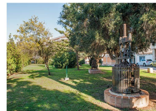
Plaza de la Agricultura Agricultura square Place de la Agricultura Agricultura Platz

PLACES OF INTEREST / VISITES D'INTERET / SEHENSWÜRDIGKEITEN