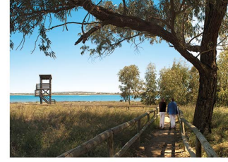
Parque Natural de Las Lagunas de La Mata y Torrevieja Salt lake Nature Reserve Parc Naturel des Lagunes de la Mata et Torrevieja Naturschutzpark der Salzseen von La Mata und Torrevieja