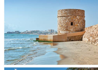
Torre de La Mata y Plaza del Embarcadero Ancient Tower and seafront square Ancienne tour et place face à la mer Alter Turm und Platz am Meer