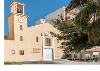
Iglesia Ntra. Sra. del Rosario Church Ntra. Sra. del Rosario Eglise Ntra. Sra. del Rosario Kirche Ntra. Sra. del Rosario