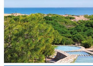
Paraje Natural Molino del Agua Nature Spot Parc Naturel Naturgebiet Molino del Agua