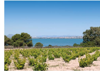
Viñedos Wineyards Vignes Weinberge